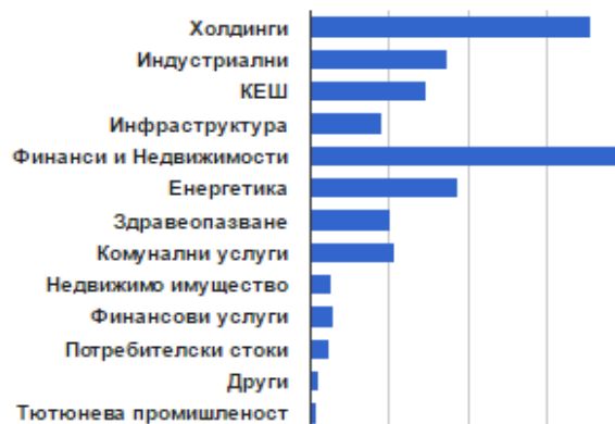
Разпределение по сектори